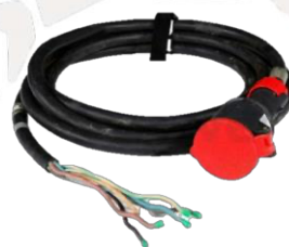
?????? 0,00€ HT