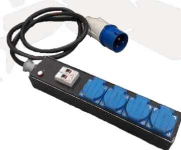
MULTIPRISE 32A MONO