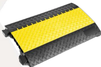
TEMA10 5 VOIES/DEFENDER 14,00€ HT