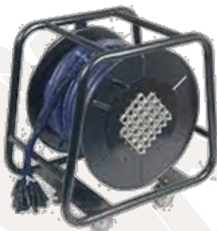
MULTI 24 IN 8 OUT/30M 60,00€ HT