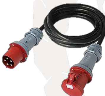
RALLONGE 63A TETRA 0,00€ HT