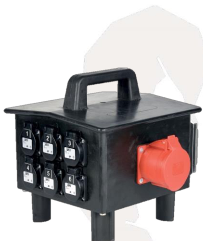
BOITIER 32A TETRA