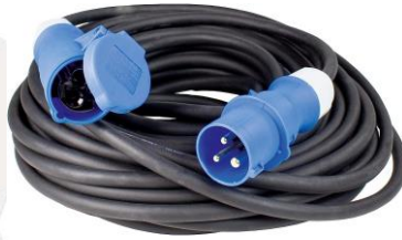
CABLE 32A MONO