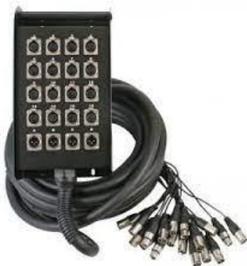
MULTI 12 IN 4 OUT/30M 18,00€ HT