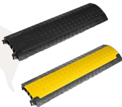
MINI 3 VOIES/DEFENDER 12,00€ HT