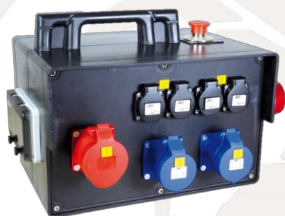
BOITIER 63A VERS 32 MONO