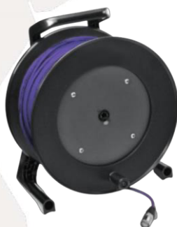
ENROULEUR/RJ45 18,00€ HT