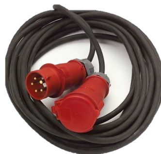
RALLONGE 32A TETRA 0,00€ HT