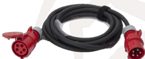
RALLONGE 16A TETRA 0,00€ HT