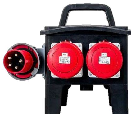
BOITIER 63A TETRA